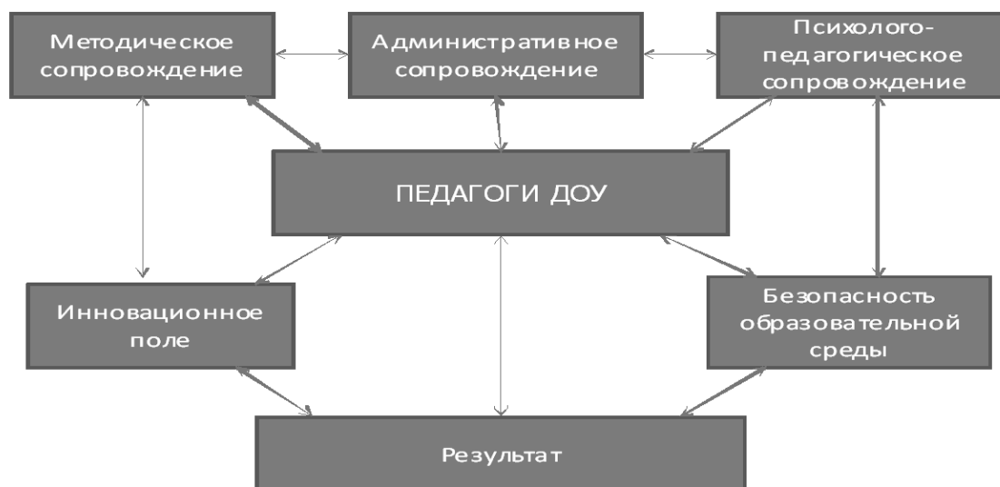
Рисунок. Модель тьюторского сопровождения педагогов МБДОУ №155 г. Кемерово по обеспечению их практической деятельности

В рамках реализации проекта для оказания научно-методической помощи воспитателям ДОО на диагностической индивидуализированной и дифференцированной основе нами была разработана блочная модель методической работы.